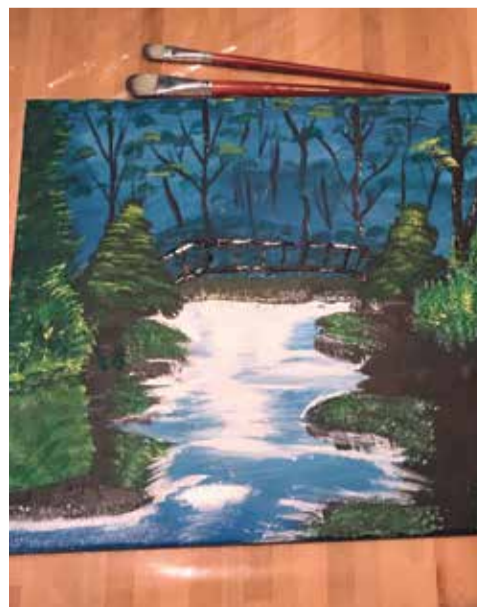
Een 'echte' Bob Ross.

Een spel spelen met je vrienden, hoe doe je dat nu? Hoe houd je genoeg afstand? Samen met mijn vrienden speel ik online. Via de app Discord kunnen we met elkaar praten. Zo kunnen we samen spelen of gewoon gezellig kletsen.